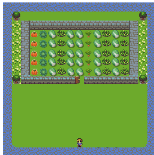
FIGURE 2 – Le jardin à la fin